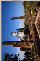
อุทยานประวัติศาสตร์สุโขทัย