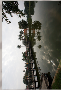
วัดตระพังทองกลาง